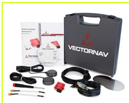
Development Board (SMD)