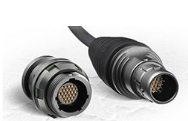
konektor (norma DO-160G)