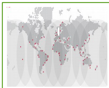
mapa zasięgu TerraStar