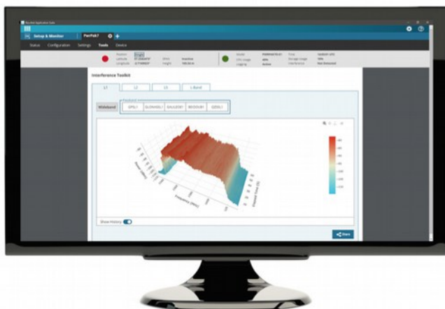
komponent 1: Setup&Monitor