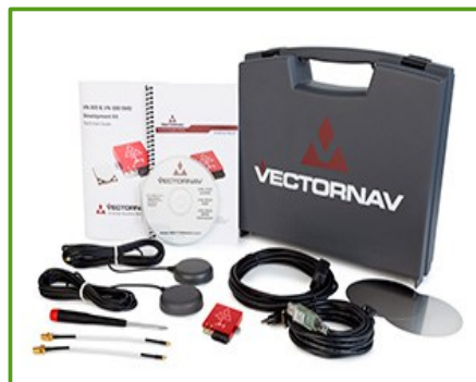
Development Board (SMD)