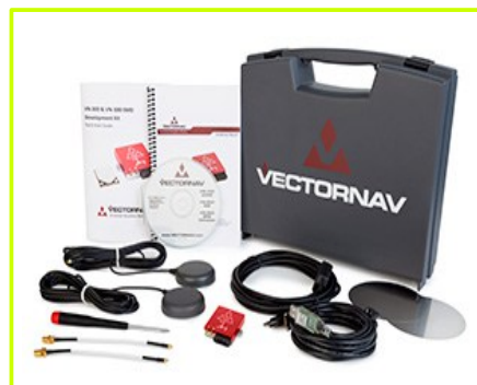
Development Board (SMD)