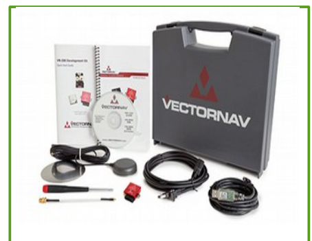
Development Kit (Rugged)