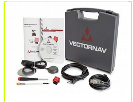
Development Kit (Rugged)