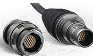
konektor (norma DO-160G)