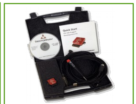
Development Kit (Rugged)