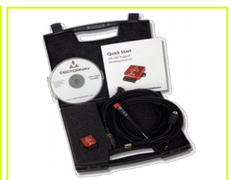
Development Kit (Rugged)