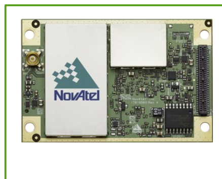
wersja bez obudowy: OEM7700