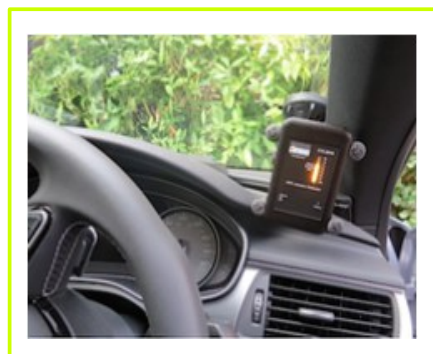
detekcja jammingu GPS