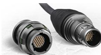
konektor (norma DO-160G)