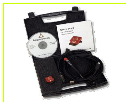
Development Kit (Rugged)