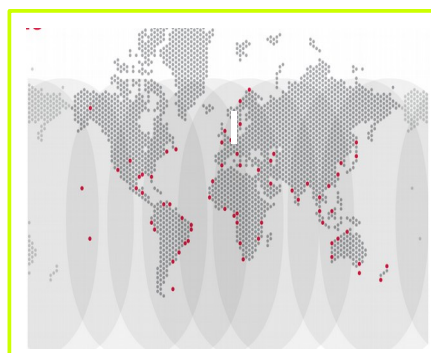
mapa zasięgu TerraStar