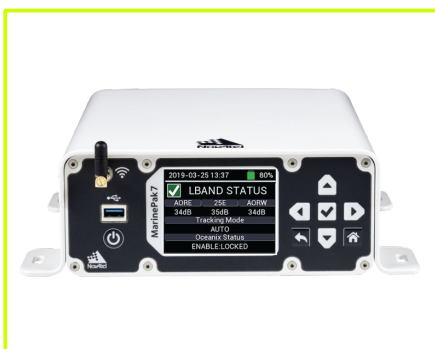
Opcja: odbiornik morski MarinePak.

Wynik hydrografii dna morskiego bez i z kompensacją Heave. Obraz kompensowany jest bardziej koherentny.