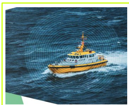
Opcja: morski sygnał korekcyjny 3 cm.