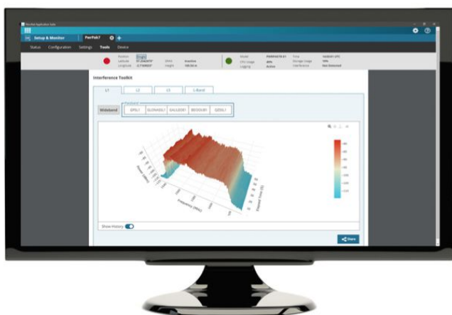
komponent 1: Setup&Monitor

Setup&Connect pozwala na konfigurację i zarządzanie wieloma odbiornikami NovAtel jednocześnie. Dodawaj, grupuj i podłączaj urządzenia lokalne i zdalne. monitoruj ich status i jakość rozwiązania.