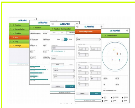
Interfejs web odbiornika SMART7 i RELAY7