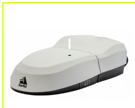
RELAY7 połączony z odbiornikiem SMART7