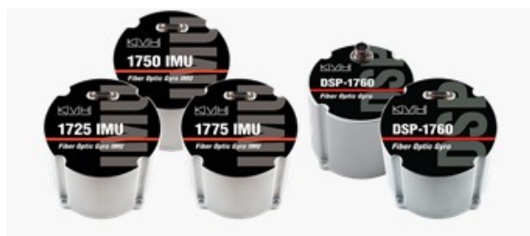
kompatybilne jednostki KVH