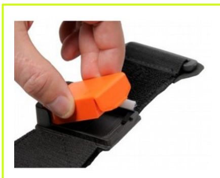
sensor MTw w taśmie