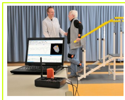
system na człowieku