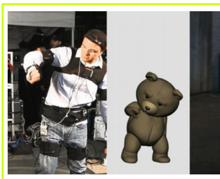
zastosowanie: program TED