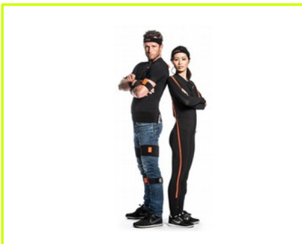
obsługiwane kostiumy MVN

dostępny jako licencja roczna lub permanentna dostępny pakiet wsparcia technicznego i aktualizacji