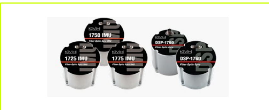
kompatybilne jednostki KVH