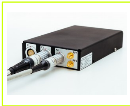
obudowa: wariant 1