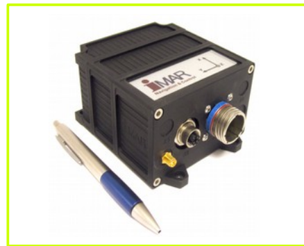
obudowa: wariant 2