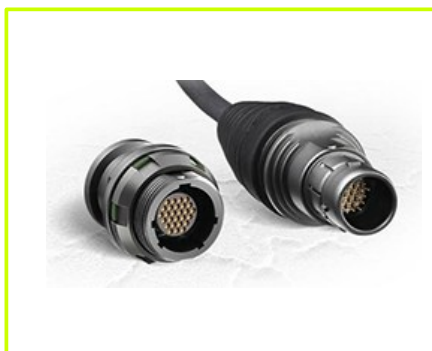
konektor (norma DO-160G)